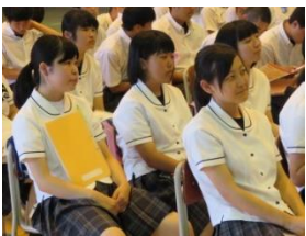
1学年進路ガイダンスの様子