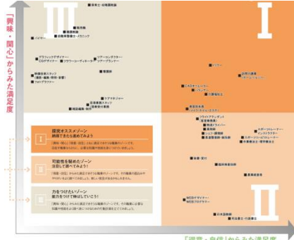
図② 職業マッピング