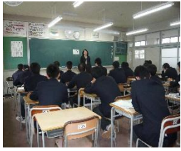
公務員希望者の様子

2年生の皆さん、来年の今頃には、希望する進路が決定していることを目標とし、日々の学校生活を充実させましょう。 (進路指導部 山口)