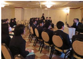
仕事内容の説明を受ける様子 (弘前パークホテルにて)