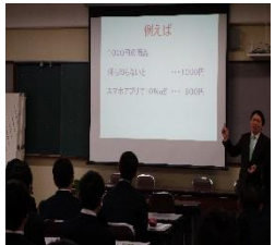
就職希望者の様子