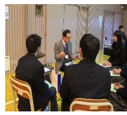
進学希望者の様子