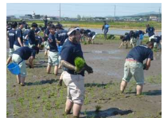
泥まみれは勲章？の男子生徒