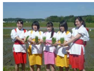
美しい早乙女姿の女生徒たち

競技は正確さと仕上がりで順位を決めますが、今年度は1位が生物生産科、2位が食品科学科、3位が環境土木科、4位が森林科学科となりました。見学に来てくださった保護者や地域の方々、ありがとうございました。