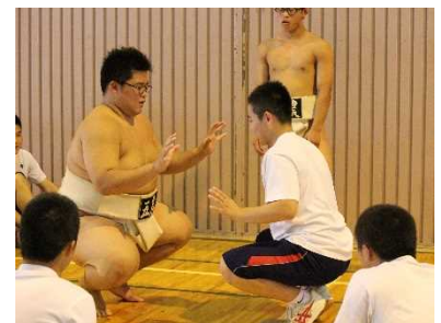
部活動体験では、相撲部と勝負もできる!?