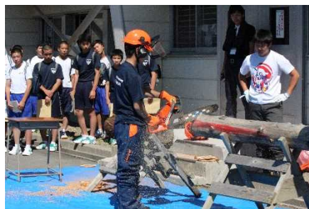
チェーンソー実演の見学。迫力！