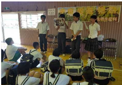
学科の紹介の様子。緊張の説明