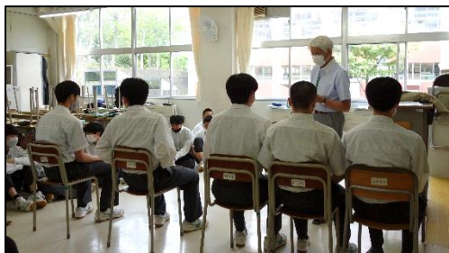
面接基礎講座を受講している様子