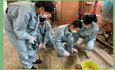
きのご菌打ち込み実習

伐木実習後の丸太をチェーンソーで玉切りにしていく実習です。2年生は学校で、3年生では大東農園で本格的な実習を行います。