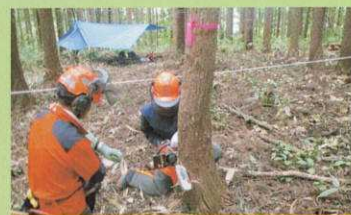
森林科学(伐倒実習)

ホダ木にシイタケの種菌を打ち込む原木栽培の実習です。2年後には菌床栽培とは違うシイタケができます。