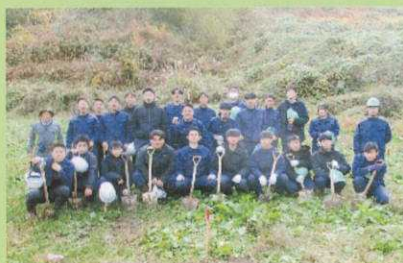
森林科学(ウルシ植林)

就職や公務員試験を目指すためにも勉強が大切です。それも5教科です。大学進学であれば、英語検定や数学検定の準2級や2級が必要になります。本校から森林組合や道県庁、国公立大学(農学系)に進んでいる生徒は、日々の授業を大切に学習に取り組んでいます。人間、どこかで真剣に勉強をしないと自分が就きたい仕事には就けません。また、資格取得も大切です。企業では資格手当があり、あるのとないのとでは年収で何十万も差が出ます。勉強するには精神力と体力が必要です。本校にはそれを鍛える運動部がたくさんあります。是非、五農で勉強と部活動を両立させて、自分の未来を描いてみよう！