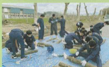
林産物利用(シイタケ栽培)

ホダ木にシイタケの種菌を打ち込む原木栽培の実習です。2年後には菌床栽培とは違うシイタケができます。